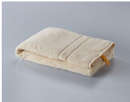
「プレミアムコンパクトバスタオル」4,644円～5,184円。 風合いの違いで3タイプ(140、332、540)。各3色展開。